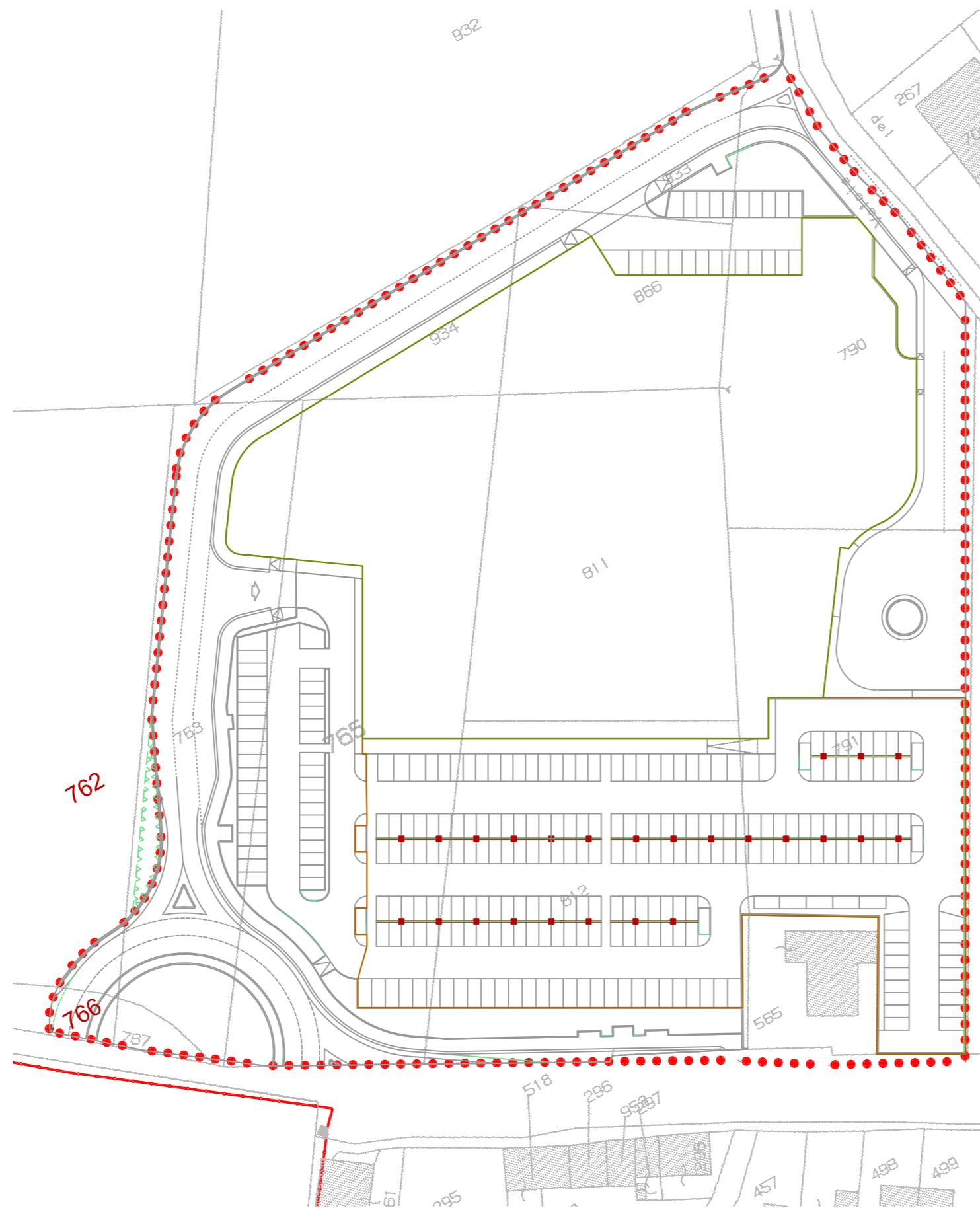
SOVRAPPOSIZIONE AREA DA CEDERE SU BASE CATASTALE - scala 1:1.000

PIANO URBANISTICO ATTUATIVO - FEBBRAIO 2014